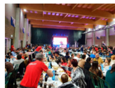
DJ SET by Prince DJ